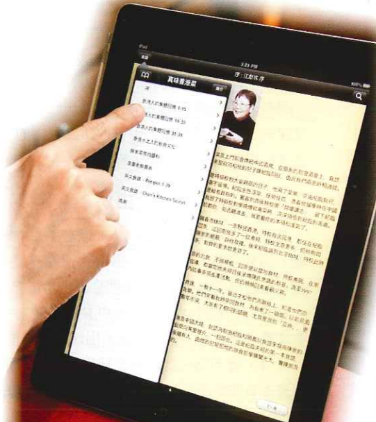
iPad 大大提升看電子書的舒適度及樂趣。