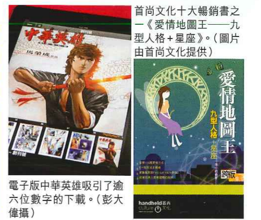
電子版中華英雄吸引了逾六位數字的下載。