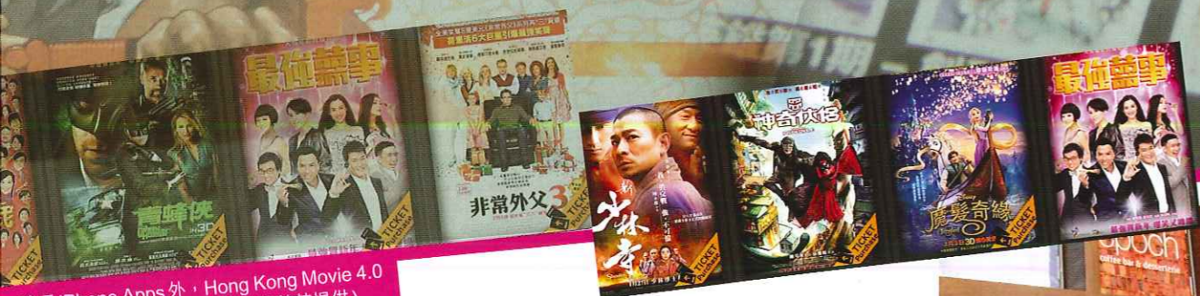
除了 iPhone Apps 外，Hong Kong Movie 4.0 特別推出 iPad 版本。